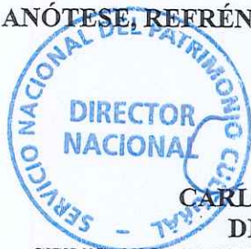
CARLOS MAILLET ARÁNGUIZ DIRECTOR NACIONAL SERVICIO NACIONAL DEL PATRIMONIO CULTURAL

ANÓTESE, REFRÉNDESE, PUBLÍQUESE Y COMUNÍQUESE.