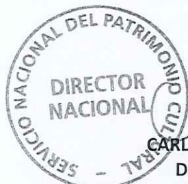
CARLOS MAILLET ARÁNGUIZ DIRECTOR NACIONAL SERVICIO NACIONAL DEL PATRIMONIO CULTURAL