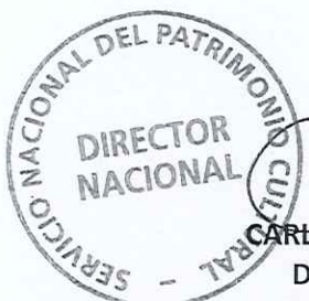
CARLOS MAILLET ARÁNGUIZ DIRECTOR NACIONAL SERVICIO NACIONAL DEL PATRIMONIO CULTURAL