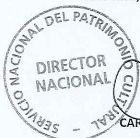
CARLOS MAILLET ARÁNGUIZ DIRECTOR NACIONAL SERVICIO NACIONAL DEL PATRIMONIO CULTURAL

DME/IMC/AGL/ksv Distribución - Programa Biblioredes - Sistema Nacional de Bibliotecas Públicas, SNPC - Entel S.A. - I.M. de Monte Patria - Oficina de Partes, SNPC. - Archivo, SNPC.