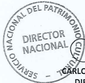
CARLOS MAILLET ARÁNGUIZ DIRECTOR NACIONAL SERVICIO NACIONAL DEL PATRIMONIO CULTURAL