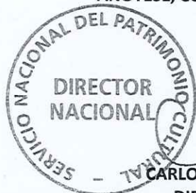
CARLOS MAILLET ARÁNGUIZ DIRECTOR NACIONAL SERVICIO NACIONAL DEL PATRIMONIO CULTURAL